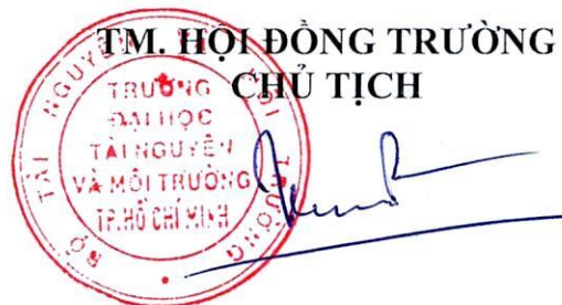
Vũ Xuân Cường